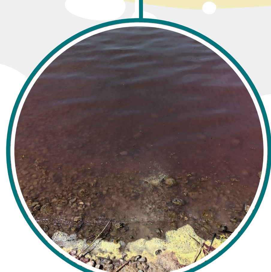
Planktothrix rubescens (Burgunderblutalge)