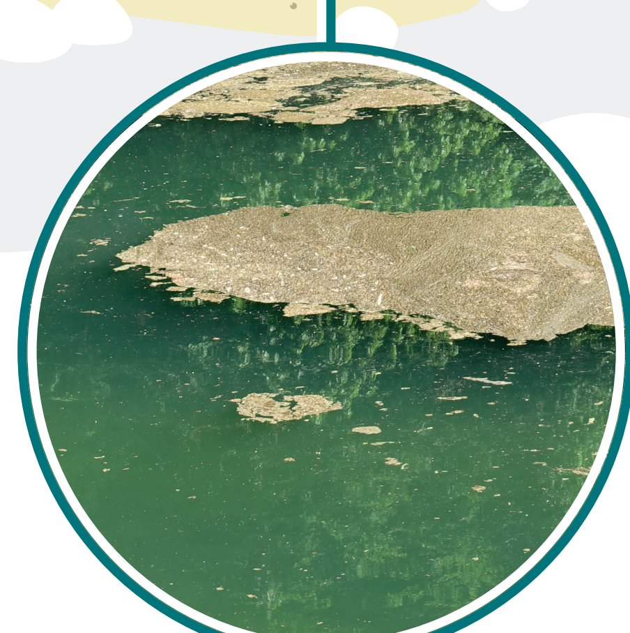
Oscillatoriales (Fädige Blaualgen)