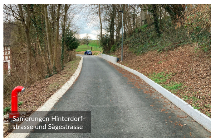
Sanierungen Hinterdorfstrasse und Sägestrasse

«Im Mai wurden die Bauarbeiten für die neue Bushaltestelle und Querungshilfe an der Konstanzstrasse unter der Leitung des kantonalen Tiefbauamts abgeschlossen. Die bessere Erschliessung für öV und Langsamverkehr dient der weiteren Entwicklung des Gewerbegebiets.»