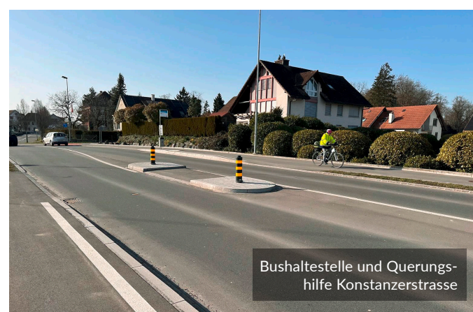
Bushaltestelle und Querungshilfe Konstanzstrasse