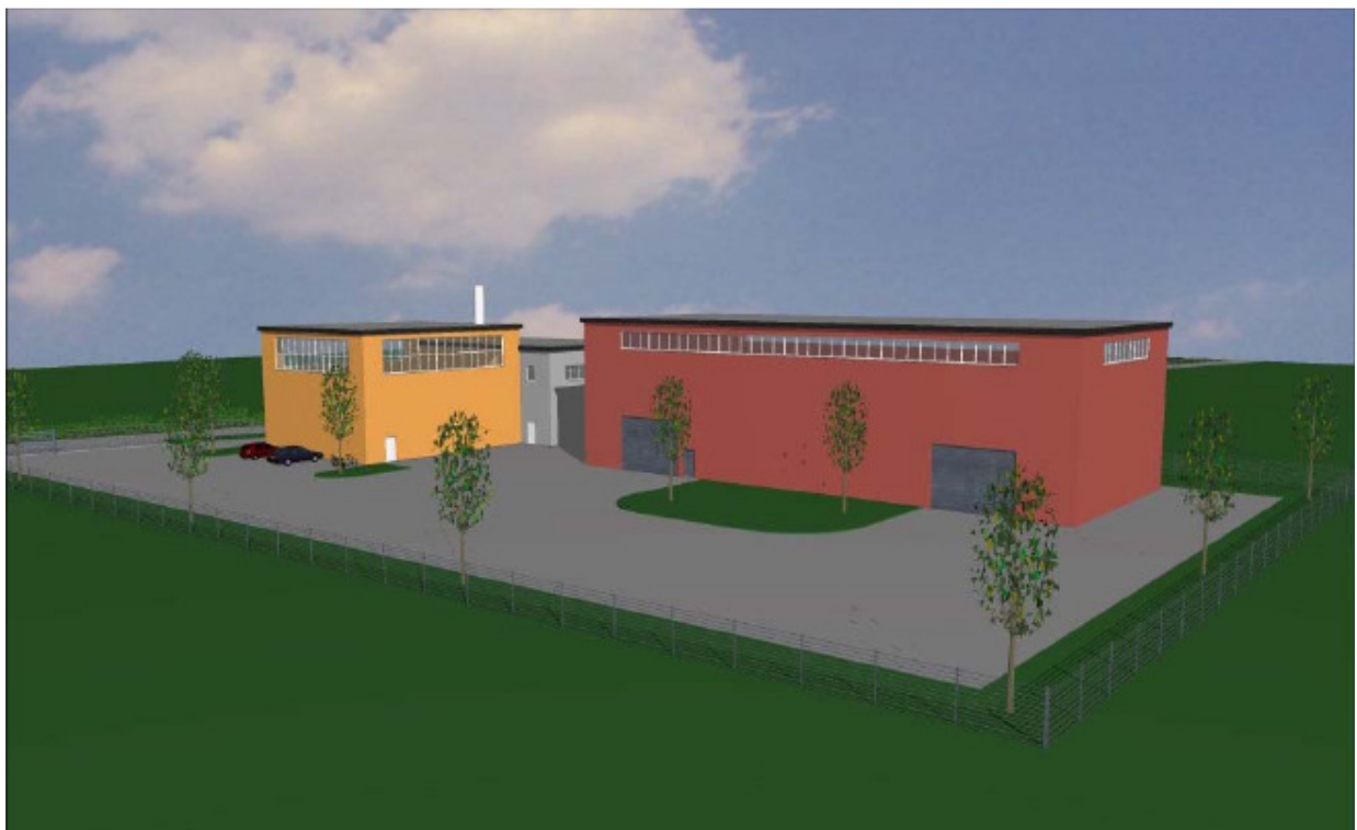
Studie für die Holzverstromungsanlage Tägerwilen

Der Gemeindeammann Der Gemeindeschreiber Markus Thalmann Alessio Beneduce