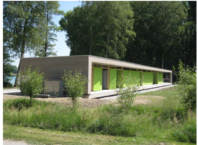
Seerheinbad Mai 2011