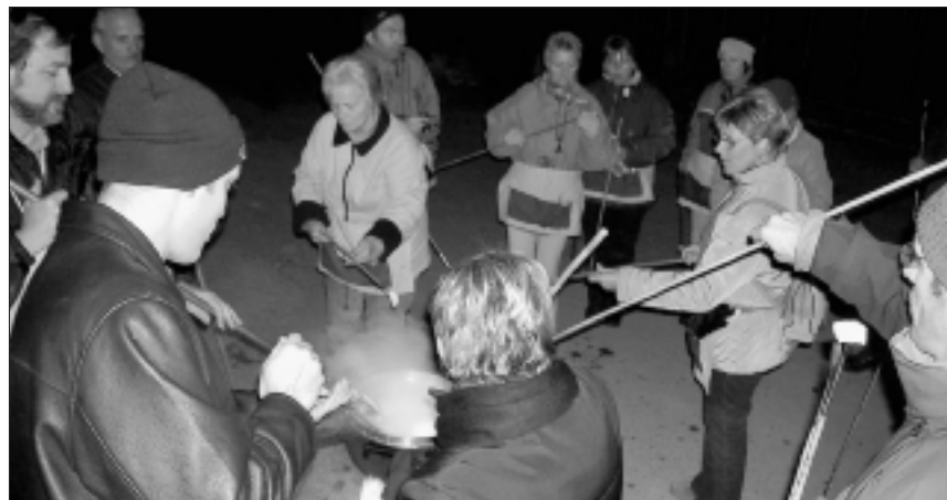
Der Fondueplausch im Freien, organisiert vom Frauenverein.