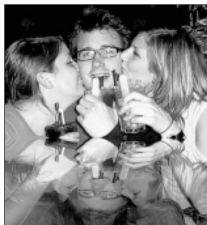
Prosit im «Louisiana».

Das «Louisiana»-Team wünscht allen noch viel Erfolg und gute Gesundheit im 2005 und bis bald. Turi & Team