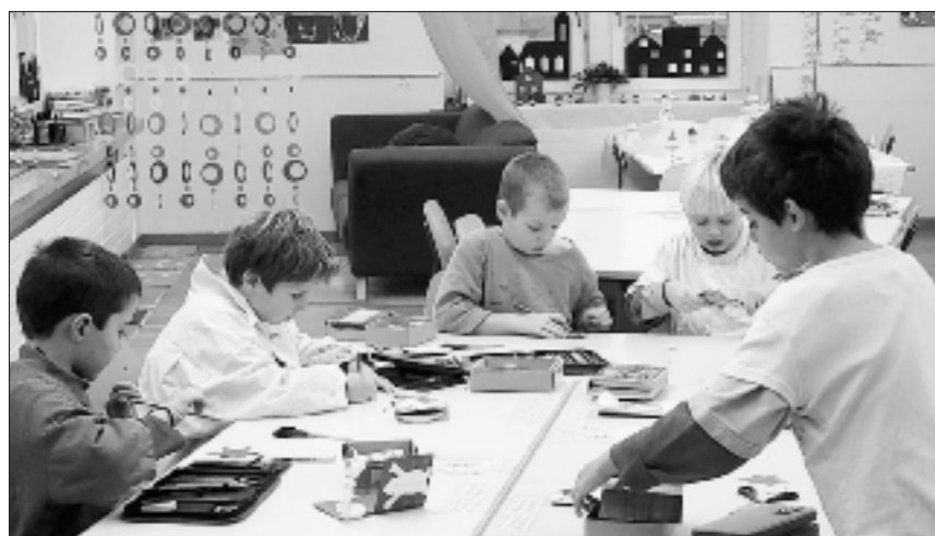
Versunken in die Bastelarbeit.